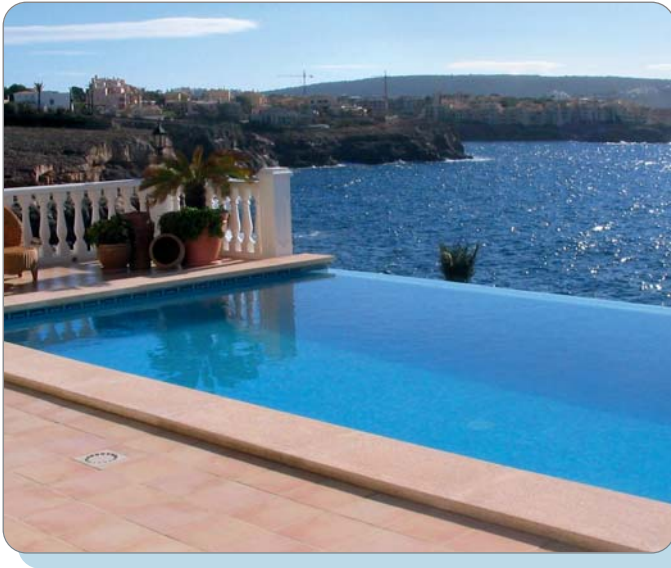
Abbildung C: Gepflegte Poolanlage