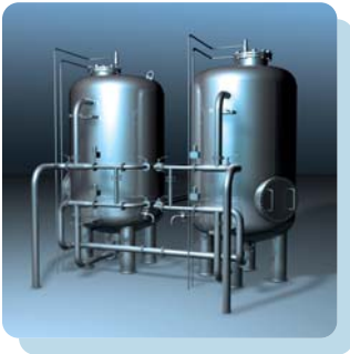
Abbildung A: Filtration mit losen Schüttungen

Als Flockungsmittel dienen verschiedene Aluminium- und Eisensalze. Diese werden dem Ablaufwasser aus der Überlaufrinne zugegeben. Üblicherweise ist die Oberfläche der feinen Partikel negativ geladen. Dies führt zu einer Abstoßung dieser Teilchen aufgrund ihrer Ladung, sodass sich keine Flocke ausbilden kann. Durch die Zugabe der positiv geladenen Salze werden die Teilchen neutralisiert. Dies hat zur Folge, dass sich Flocken bilden, welche durch mechanische Filtration zurückgehalten werden können. Für eine effektive Flockung sind die Einstellung des pH-Wertes und die richtige Dosierung von Chlor entscheidend. So muss - je nach verwendetem Flockungsmittel - ein bestimmter pH-Wert zwingend eingehalten werden. Geht der pH-Wert zu weit in den basischen Bereich (alkalischer pH 7 bis 14) wird der Flockungsprozess verhindert und es kommt zur Trübung des Wassers. Auch die Unter- bzw. Überdosierung des Flockungsmittels kann zur Trübung führen. Ebenso kann eine Erhöhung der Chlordosierung die Flockungsfähigkeit reduzieren und das Wasser eintrüben.